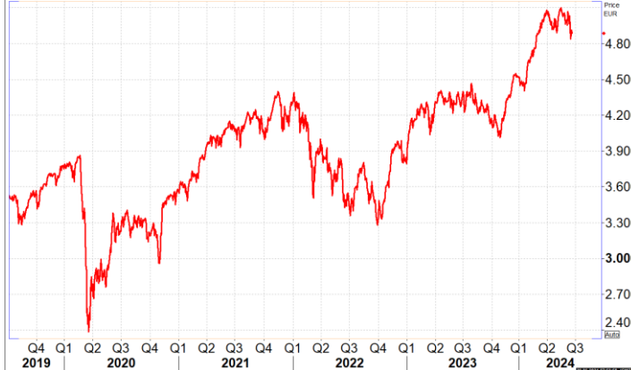
Daily EuroStoxx 50