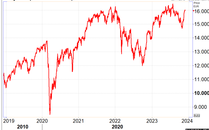
Daily Dax