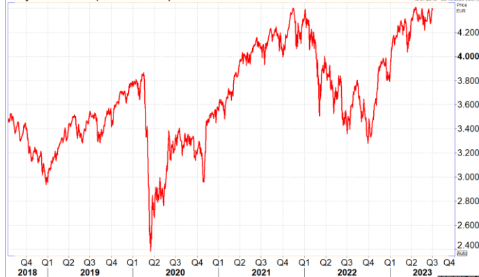
Daily EuroStoxx 50