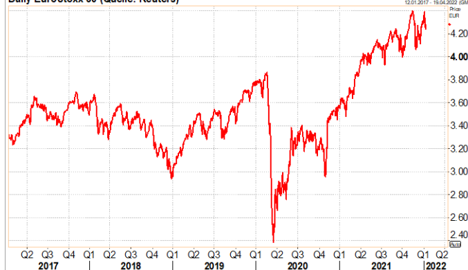
Daily EuroStoxx 50