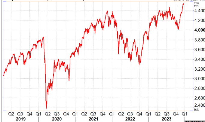
Daily EuroStoxx 50