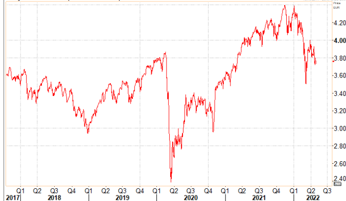
Daily EuroStoxx 50