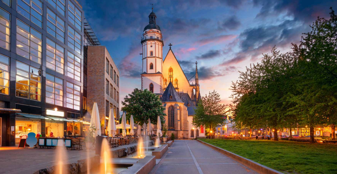
Blick auf die Leipziger Thomaskirche