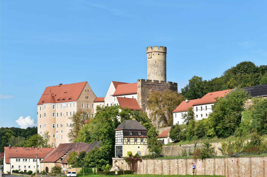
Burg Gnanstein in Frohburg